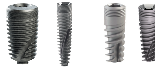
SB/LA Spiral Implantat SNAP & NL-SNAP